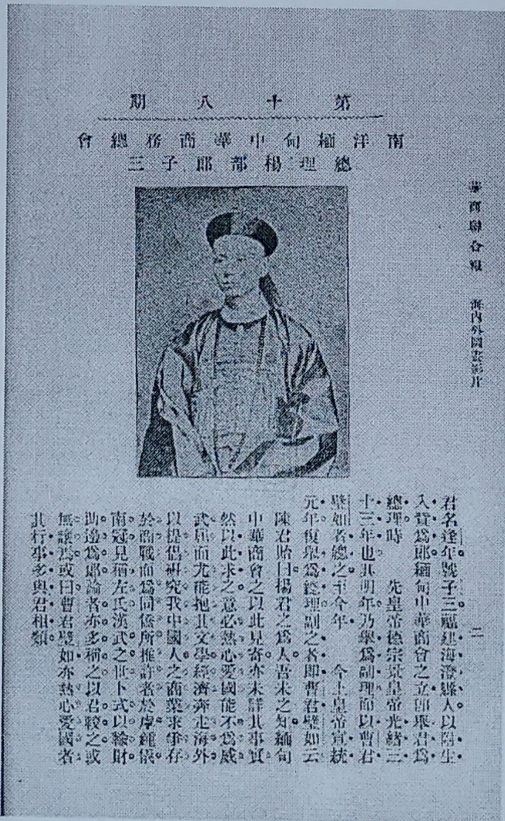
左：華商聯合報1909年第十八期