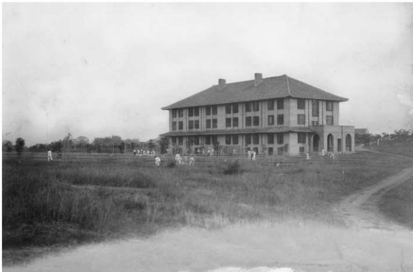
張弼士堂（Chang Hall），即華僑學校校舍。

岭南大学从创立之日，就招收海外归来的华侨子弟入学。民国初年岭大正式附设华侨学校，“专为利便华侨学生归国求学及促进华侨教育。”华侨学校的校舍由南洋华侨捐资修建。如陈嘉庚捐资兴建附属小学礼堂的陈嘉庚堂，就落成于1919年6月。張弼士堂建於1921年，由張弼士之子張秩摺捐建。另有一座仰光屋建於1925年。陆佑堂1931年建成；胡文虎于1934年亦捐资兴建文虎堂。