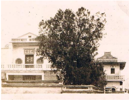
1913 年的桐蔭樓與景裴別墅