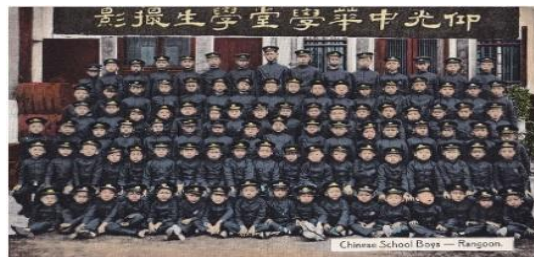
A Chinese School Boys - Rangoon, Postcard by D A Ahuja, No. 287, circa 1910