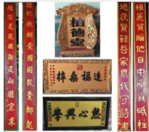
仰光植德堂堂内部分牌匾

（仰光植德堂大厦的第三、第四层做为植德堂永远会所，三楼设有霞阳楊氏始祖神龛，四楼设有使头公佛殿，一直沿用至今。）