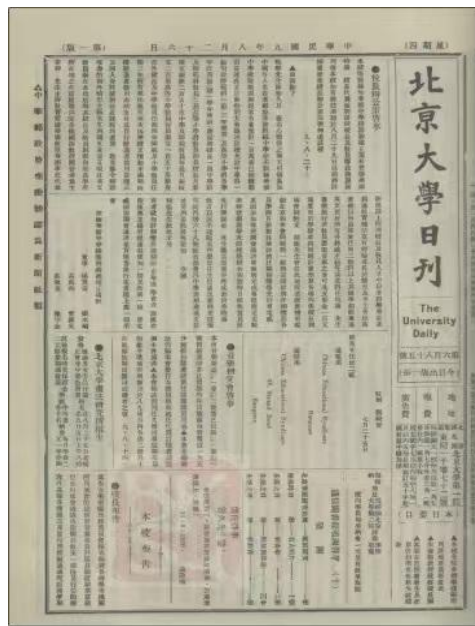
1920年北京大学日刊第685期报导

楊昭固通过华侨学务总会与国内民国政府教育部联系，在缅甸华校推广新的国民教育体制和教材，也包括引进与培养师资力量，如1918年在仰光设立师范学校，1919年举办全缅华校代表研究教育大会，1920年、1921年举办缅甸/南洋华校教育成绩展览会。1921年，楊昭固出任仰光华侨中学校董，而于前一年即以缅甸华侨学务总会之名致信请求时任教育部部长的蔡元培先生代为聘请华中老师。