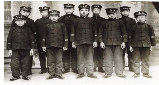
霞陽小学身穿警察服装的学生在军训