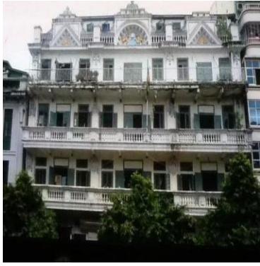
仰光南勃陶路 仰光中华学校